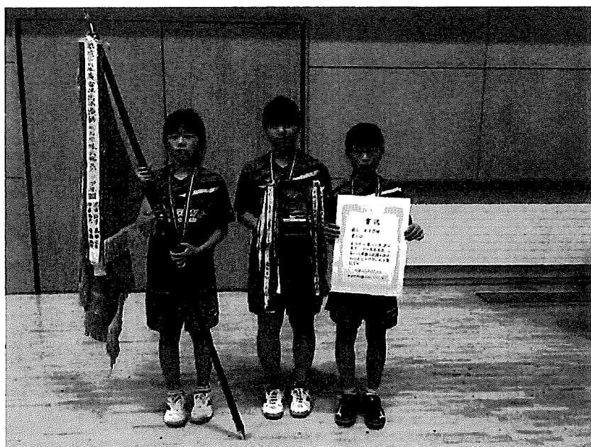
前年度女子優勝 ドラゴン Jr A